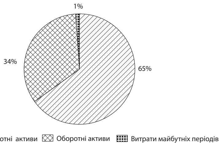
Рис. 5. Типова структура активів підприємств з виробництва та розподілення

що включає в себе: оновлення парку приладів обліку, встановлення приладів обліку на фасадах житлових будинків, реконструкцію трансформаторних підстанцій, енергомереж зі встановленням ввідних приладів обліку, а також реконструкцію повітряних ліній. У першу чергу це стосується підприємств з газопостачання.