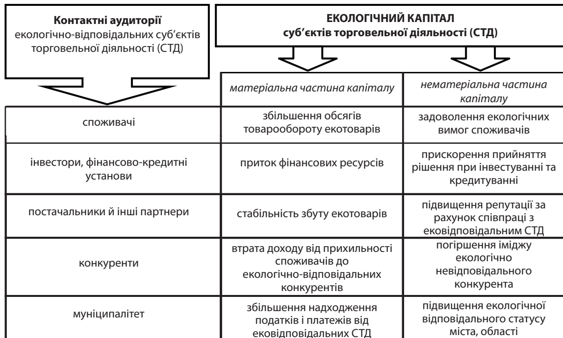
Рис. 2. Структура екологічного капіталу суб'єктів торговельної діяльності

Для збільшення екологічного капіталу суб'єкти торговельної діяльності самостійно формують асортимент товарів з точки зору його екологічності і шкідливості по відношенню до довкілля.