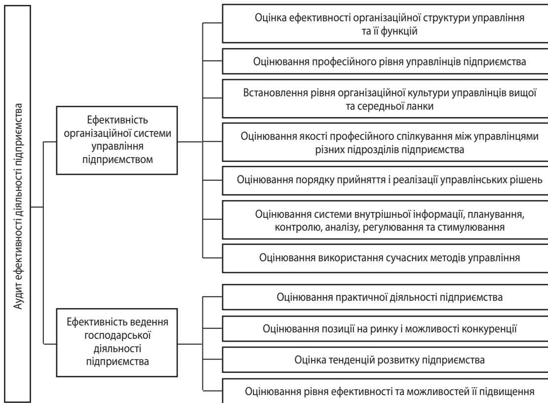
Рис. 2. Основні напрями перевірки за об'єктами аудиту ефективності діяльності підприємства