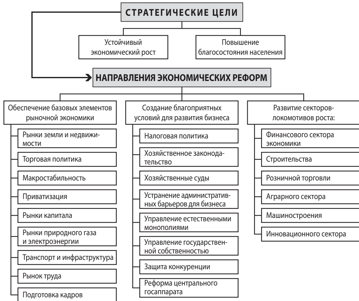
Рис. 3. Отдельные фрагменты структуры «Концепции экономического развития Украины на 2008 – 2015 гг.» [11]

Согласно табл. 2, для регионов Украины на государственном уровне определены от 3 до 9 приоритетов развития. Регионам чаще рекомендуется развивать: транспорт и инфраструктуру – 19 случаев (86,4% от всех регионов), высокотехнологичное аграрное производство – 16 случаев (72,7%); высокотехнологичное машиностроение – 15 случаев (68,2%); туристически-рекреационную сферу – 13 случаев (59,1%), экологию – 12 случаев (54,5%) и ресурсо- и энергосберегающие технологии – 11 случаев (50,0%) и др.