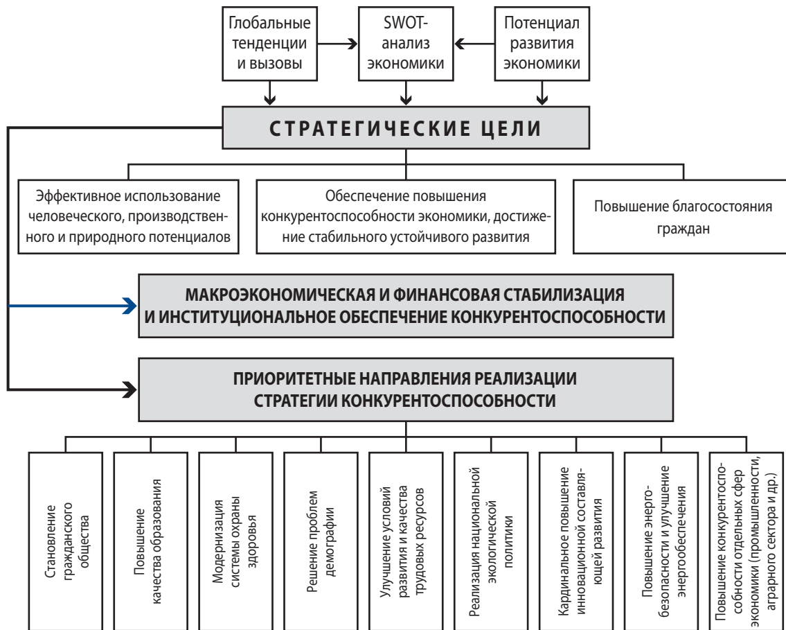
Рис. 2. Отдельные фрагменты структуры «Стратегии развития Украины до 2020 года»

Анализ обеих стратегий развития Украины [1, 2], показывает, что они, вследствие отсутствия единой методологической базы, существенно различаются между собой.