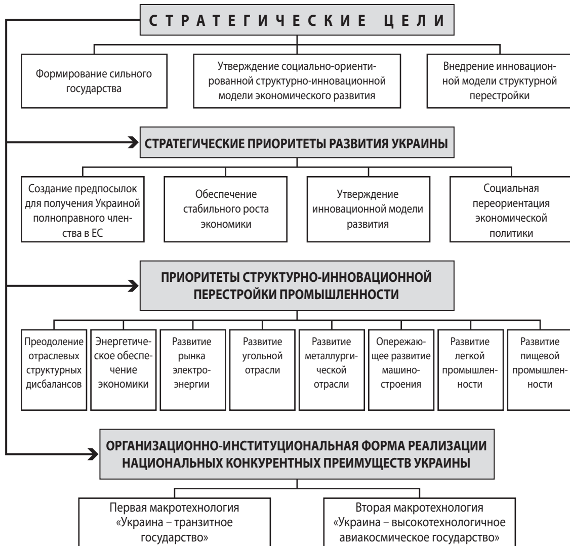
Рис. 1. Отдельные фрагменты структуры Стратегии экономического и социального развития Украины на 2004 – 2015 гг. «Путем европейской интеграции»

с тем, в работе подробно проанализированы сильные и слабые стороны украинской экономики, благоприятные возможности и угрозы для экономического прорыва по следующим направлениям (рис. 2):