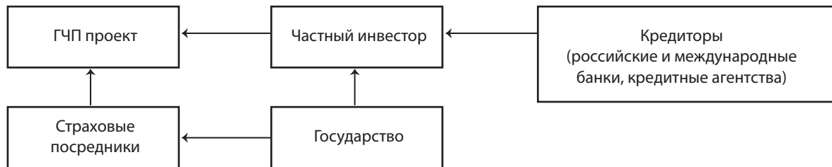
Рис. 2. Распределение рисков между участниками ГЧП

Недопустима концентрация рисков у государства, определенную их часть должно принимать на себя бизнес-