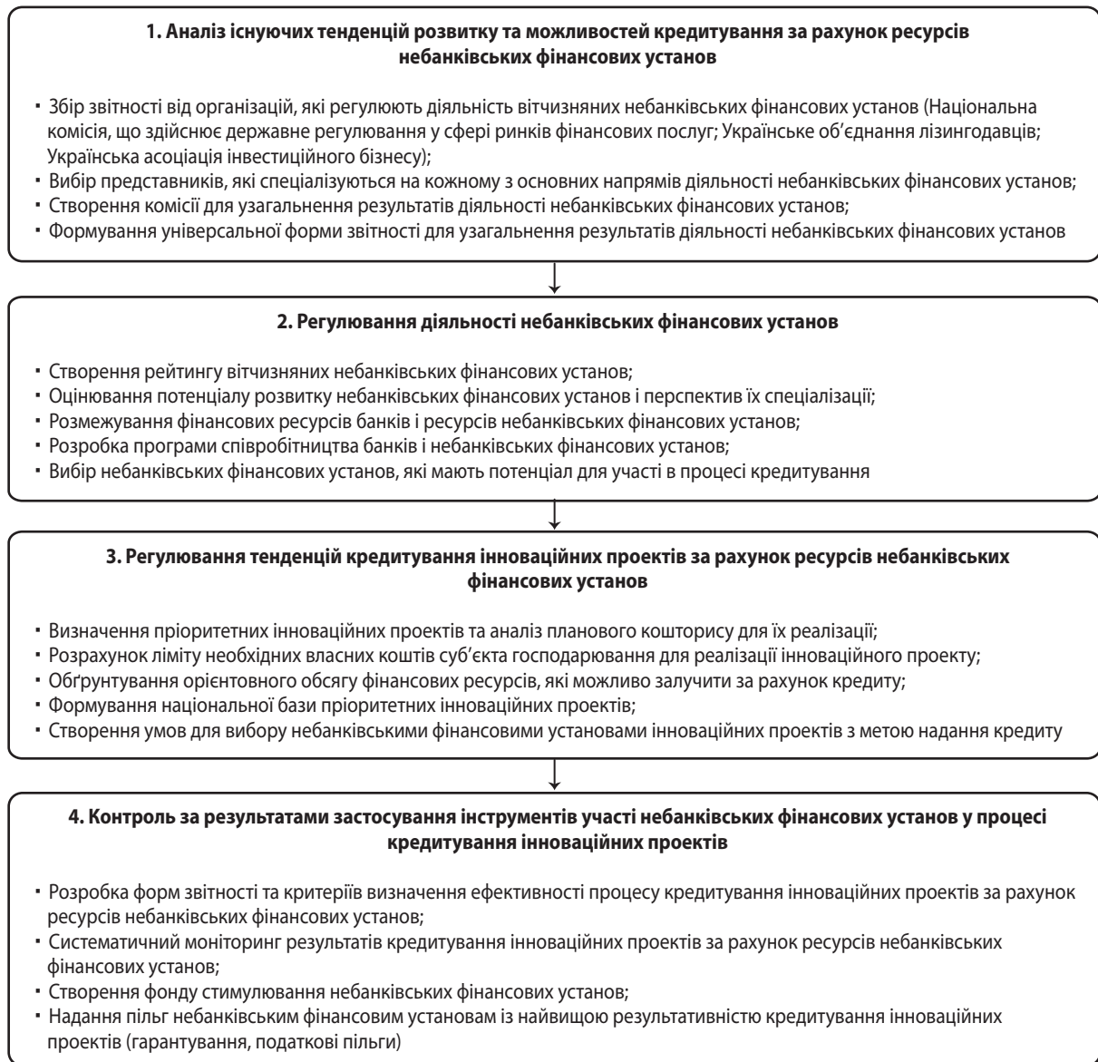
Рис. 3. План організації участі небанківських фінансових установ у кредитуванні інноваційних проектів економіки України*