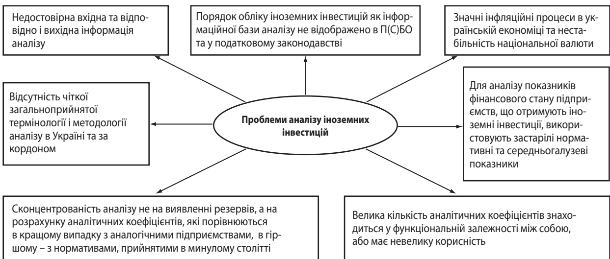
Рис. 3. Проблеми аналізу іноземних інвестицій на українських підприємствах

У рейтингу інвестиційної привабливості країн світу International Business Compass за 2015 рік, опублікованому компанією BDO, Україна за рік піднялася на 20 позицій у рейтингу і розташовується на 89 місці, входячи до переліку країн, що показали найкраще зростання за рік, нарівні з Білоруссю і Латвією. У 2014 році наша країна займала 109 місце.