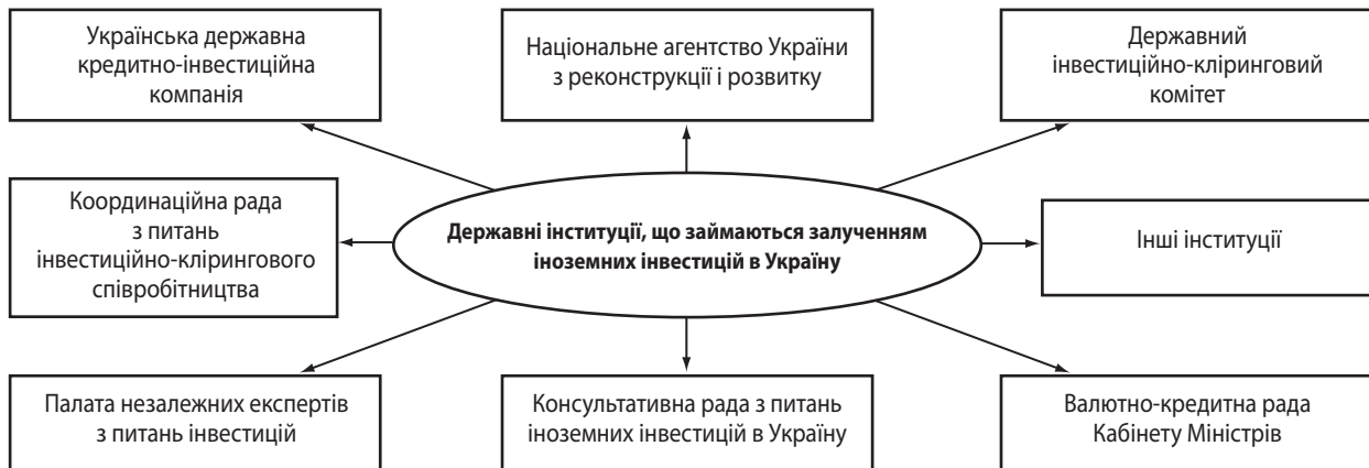
Рис. 2. Державні інституції, що займаються залученням іноземних інвестицій в Україні