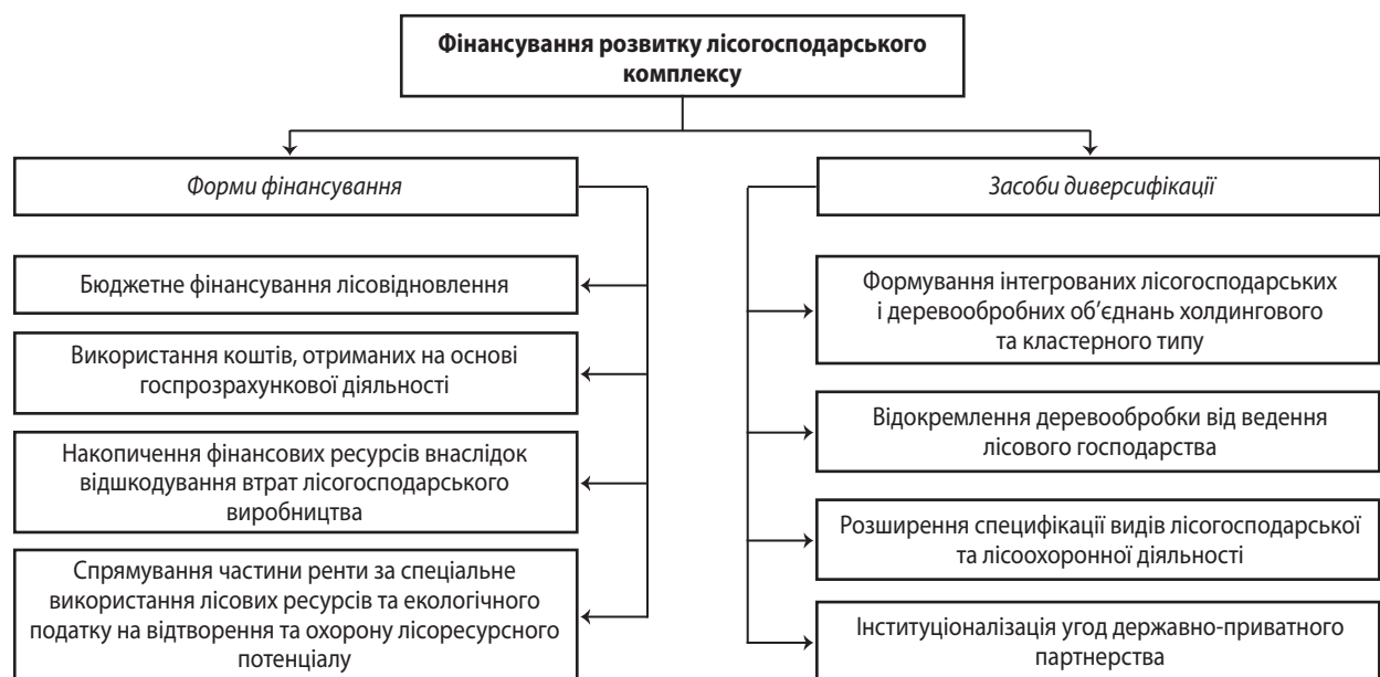
Рис. 1. Структура форм і засобів фінансування розвитку лісогосподарського комплексу

На жаль, повноцінної інституціоналізації мораторію так і не відбулося, оскільки спочатку ввели заборону на вивезення листяних порід, а хвойні породи дозволили вивозити до 1 січня 2017 року. Пролонгація дозволу на експорт