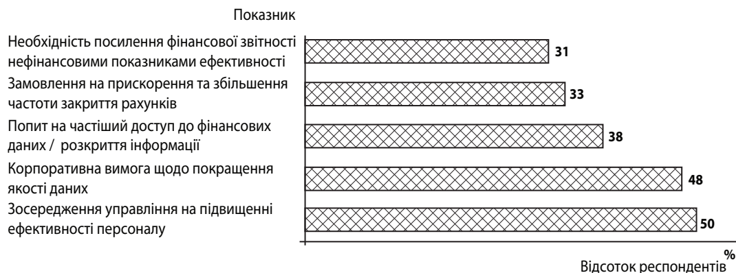
Рис. 1. Ринкові драйвери щодо використання звітності в режимі реального часу

З метою визначення переваг і перешкод у використанні звітності в режимі реального часу Міжнародною асоціацією дипломованих сертифікованих бухгалтерів (ACCA)