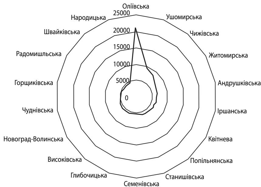
Рис. 1. Група ОТГ з високим рівнем доходів загального фонду на 1 мешканця станом на 01.01.2020, грн

У другу групу (рис. 2), з середнім рівнем доходів загального фонду на 1 мешканця (3088–4244 грн), увійшли такі громади: максимальні показники – Брусилівська (4244 грн), Краснопільська (4212 грн), Вільшанська (4146 грн); мінімальні показники – Райгородська (3120 грн), Миропільська (3099 грн), Вільська (3088 грн).