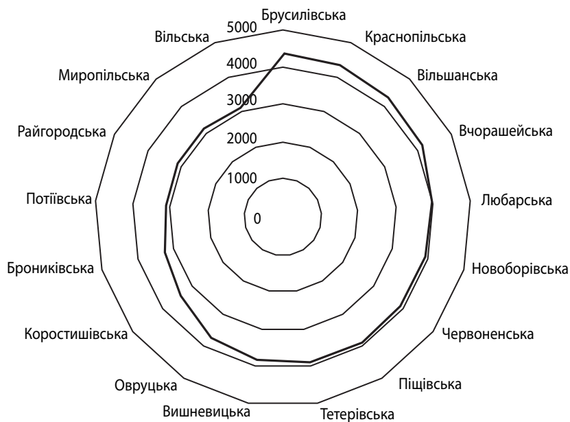
Рис. 2. Група ОТГ з середнім рівнем доходів загального фонду на 1 мешканця станом на 01.01.2020, грн