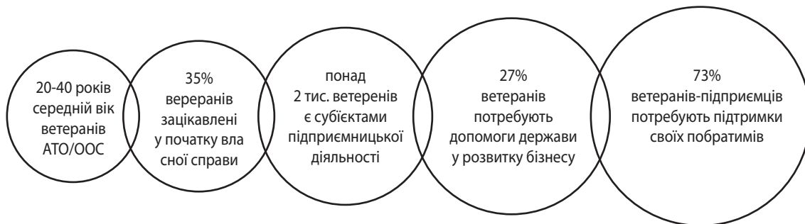
Рис. 1. Ключові характеристики портрета сучасного ветерана-підприємця

Сучасні ветерани в Україні – це переважно молоді люди, які є найбільш активними членами суспільства. За результатами досліджень Міністерства ветеранів, майже третина учасників бойових дій має бажання започаткувати власну справу (рис. 1).